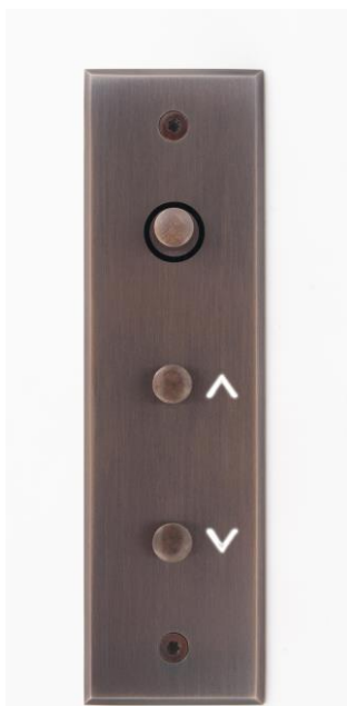
Commandes de stores finition Bronze Médaille Allemand