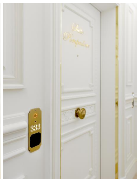
© M.A. Bulot, Lecteur de badge et numéro de porte