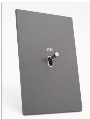
Interrupteur finition Canon de Fusil Sablé