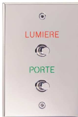
Interrupteurs finition Chromé Vif