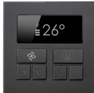
Habillage laiton d'un thermostat Black Nova, finition Nickel noir Mat Gravure lumineuse sur bouton Ventilation

La qualité des produits Meljac, qui résulte d'un savoir-faire très spécifique, fait la renommée de la marque dans le monde entier.